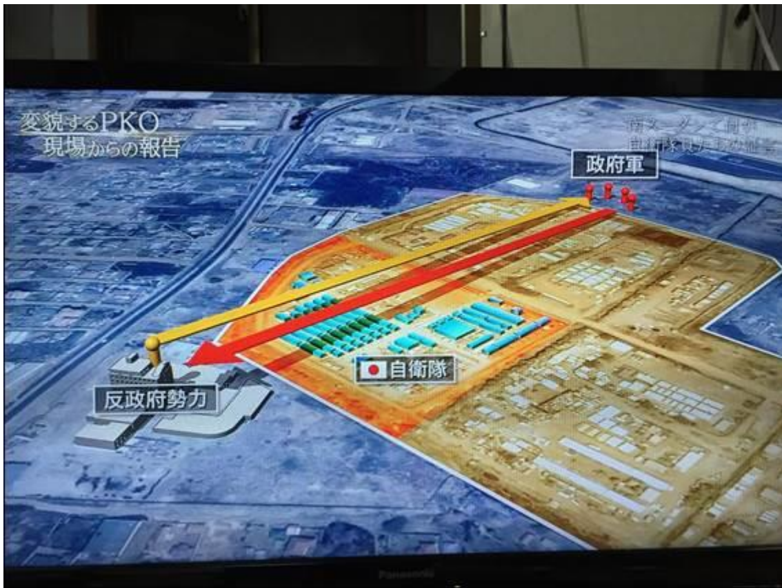
【写真1】 2016年7月、南スーダン、ジュバでの政府軍と反政府軍の戦闘の状況